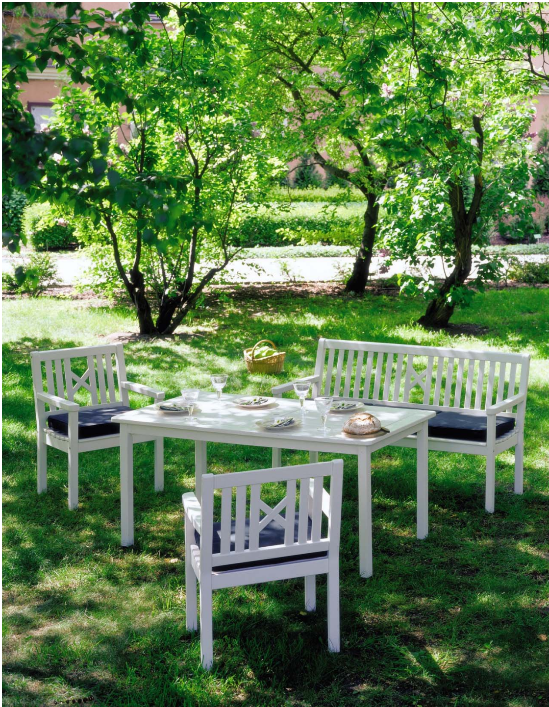
Gartenmöbel Garnitur (Buche)